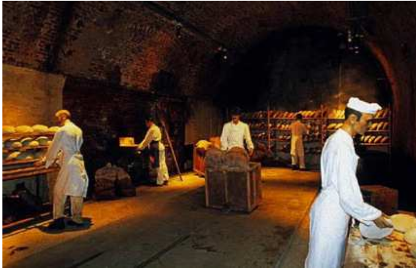
Reconstitution de la boulangerie dans la citadelle de Verdun 96 .