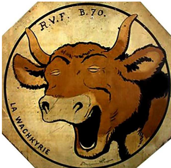
La Wachkyrie de Benjamin Rabier 97